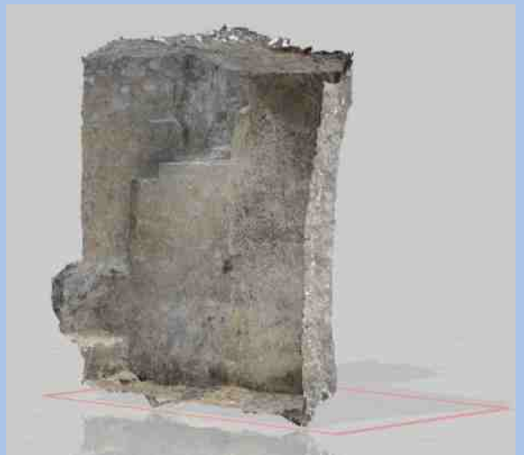
Westwand des Gefängnisses

■ Später wurden die sauber gearbeiteten Steine des „Angstloches“ in die Wölbung eingebaut. Zugleich mauerte man den Treppenabgang von Norden her zu und verkleinerte den Raum durch eine neue Westwand.