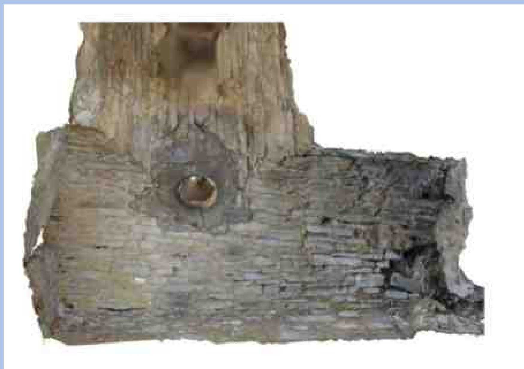
Die Wölbung mit „Angstloch“

■ Erst in einer zweiten Phase wird dieser Keller nach Norden erweitert und insgesamt mit einer Tonnenwölbung aus Bruchsteinen eingewölbt. In dieser Phase diente die Anlage wahrscheinlich bereits als Gefängnis.